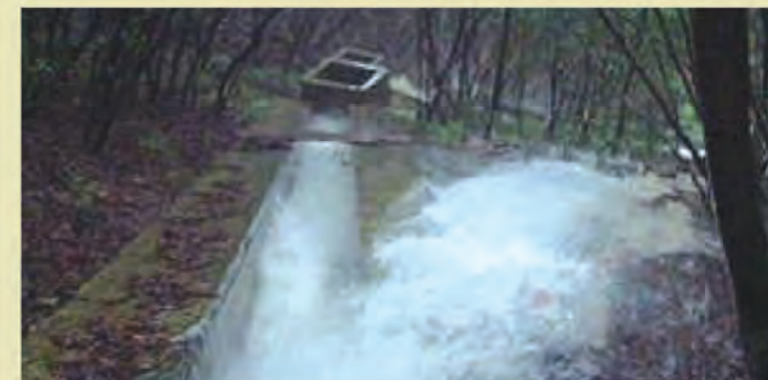
圖二 排水渠經常滿瀉或溢出