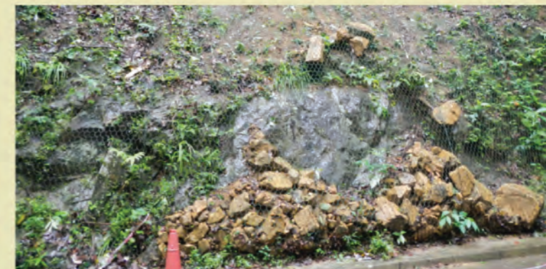
圖四 碎石被夾在金屬絲網內