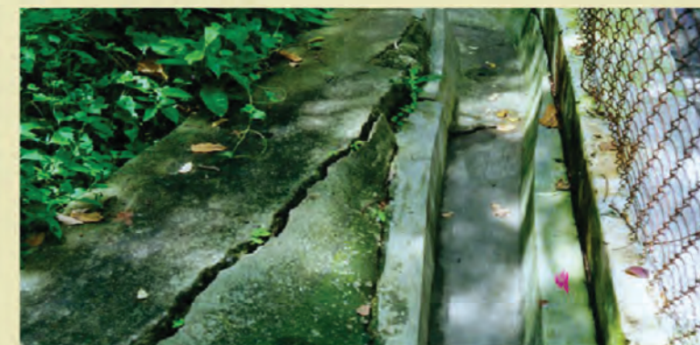
圖三 裂縫不斷擴闊